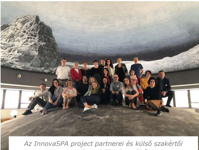
Az InnovaSPA project partnerei és külső szakértői a Vytautas Mineral SPA-ban, Birštonas

Az InnovaSPA projekt harmadik tanulmányútjára 2019. július elején került sor Litvániában . Az interregionális tanulási folyamat részeként megvalósult tanulmányút lehetővé tette a résztvevők számára, hogy megismerjék a litván termálterápiás ökoszisztémát és megvitassák azokat a politikákat, amelyek támogatják az orvosi SPA-k és wellness üdülőhelyek fejlesztését Vilniusi térségében.