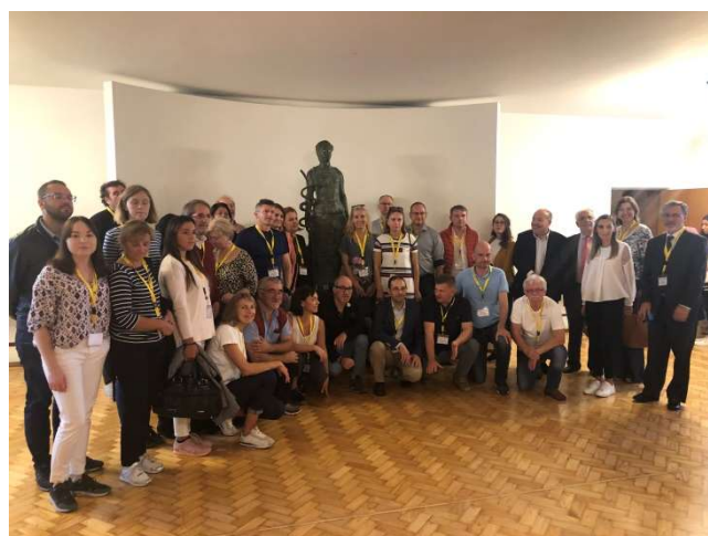
Az InnovaSPA projekt partnerei és külső szakértőinek látogatása a Portói Egyetemen

A Portói Egyetem Orvostudományi Kara fontos szerepet játszik a termálterápiák fejlesztésében is Norte régióban. A hidrológiai és klimatológiai posztgraduális képzést az Orvostudományi Karon tartják, ez az országban az egyetlen, amely termálterápiás orvosi gyakorlatot oktat. Ez a kurzus biztosítja a jelölteknek a termálterápiás egységek orvosi irányításához szükséges kompetenciákat.