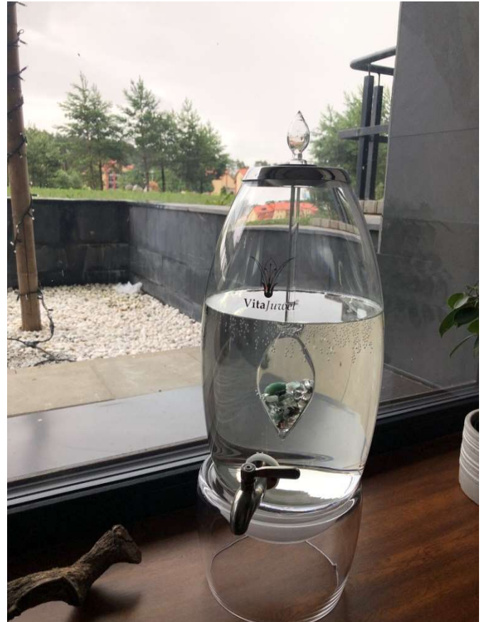
Vytautas Mineral SPA, Birštonas

A litván partnerek egyik legérdekesebb jó gyakorlata az „Innovatív egészségügyi turisztikai célpont fejlesztése Birštonasban” volt. Annak a stratégiai célnak a megvalósítása érdekében, miszerint 2030-ig nemzetközi innovatív szabadidős és gyógyfürdő-üdülőhellyé kívánnak válni, Birštonas Önkormányzata nagymértékű infrastruktúra fejlesztésbe kezdett a nyilvános gyógyfürdő-szolgáltatások területén. A meglévő egészségügyi üdülőhelyeket felújították és új, magas színvonalú üdülőhelyeket is létrehoztak. Az önkormányzat világos stratégiája és jövőképe volt az innovatív egészségügyi turisztikai célpont sikeres fejlesztésének kulcsa. A sikeres projekt szempontjából alapvető fontosságú volt az önkormányzat, a közösség és a kapcsolódó szervezetek közötti szoros együttműködés, valamint az állami és a magánszektor együttműködése. További információ