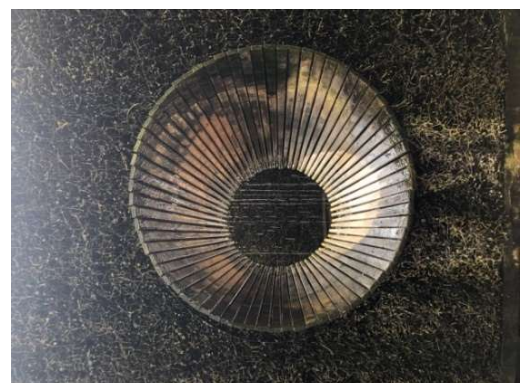
Vytautas Mineral SPA & Mineral Water Graduation Tower, Birštonas