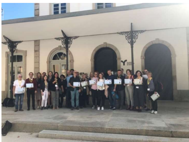
Az InnovaSPA projekt partnerei és külső szakértői a Chaves-Verín Eurocity Termál és Víziút nagyköveteiként

Az egyik legérdekesebb bevált gyakorlat, amelyet megosztottak a Norte-régióban tett tanulmányút során, a „Chaves-Verín Eurocity termál- és víziútja” volt, amelyet eredetileg a Spanyolország – Portugália határon átnyúló együttműködési operatív program (2007–2013) keretében hagytak jóvá (Interreg POCTEP) míg jelenlegi formáját (2014–2020) „Eurocidade2020” címmel ismételtén támogatták. Chaves-Verín területein a legnagyobb a termál- és gyógyforrások koncentrációja Európában (összesen tizenegy található 40 km-es körön belül). Ebben az összefüggésben a „Chaves-Verín Eurocity termál- és víziútja” olyan útvonalként jött létre, amely összeköti Verín gyógyfürdő-örökségét a Chaves-ban és Vidagoban található fürdővel, összekapcsolva az Eurocity terület fő forrásait, gyógyfürdőit és termálvizeit, egy globális útvonalat formálva ezen eurorégió (Alto Tâmega - Norte / Ourense - Galicia) földrajzi határain belül. Az útvonal mindkét település városi útvonalait egyesíti a Tâmega folyó mentén haladó kerékpár-turisztikai útvonalakkal. Verín, Chaves és Vidago városi útvonalai a történelmi, természeti és kulturális örökséget mutatják be. További információ